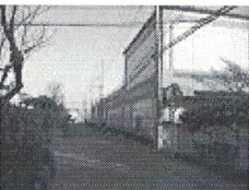
スーパーの壁、左) 大通り側、正面に駅が見える。右) 裏道側

どうやら自治医大駅周辺は、車社会に合わせて設計されていて、街を散歩するにはできていない。壁は人を排除するもので、すさんだ雰囲気にする。この壁通りをニューヨークのウォールストリートにならって、しもつけのウォールストリートと呼ぼう。