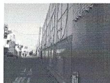
本屋の壁、左) 大通り側、右) 裏道側

本屋を越えると、次のブロックにも壁がそびえる。スーパーマーケットの壁である。本屋と同じように、玄関と駐車場は駅とは反対側にあり、大通りと裏道の両サイドは壁になっている。